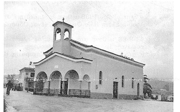
Κλαδάς: Ο Άη-Δημήτρης.

Η δεύτερη νέα γέφυρα, θα κατασκευαστεί - σε αντικατάσταση της παλιάς - επί του χειμάρου Κελεφίνας, που βρίσκεται στο 4 χιλ. της Εθνικής οδού Σπάρτης - Τρίπολης. Η νέα γέφυρα θα έχει άνοιγμα 68 μέτρα και πλάτος 14 μέτρα.